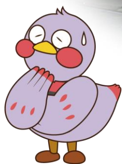
埼玉県のマスコット 「さいたまっち」