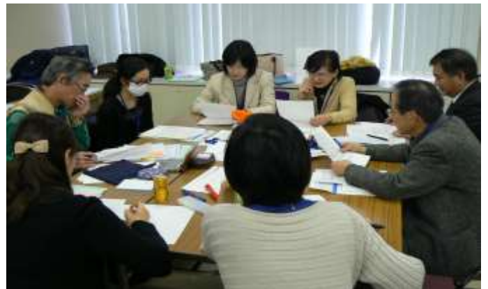
グループで話し合いながら災害文書を翻訳