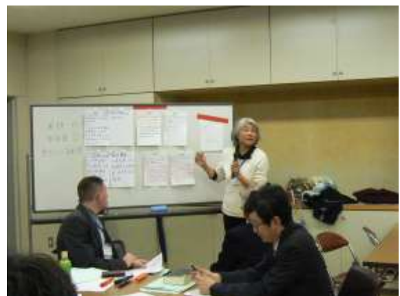
グループごとに、気をつけたところなどを発表