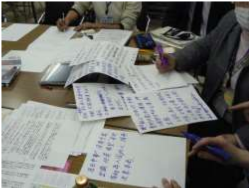
翻訳した文書を外国人に分かりやすいようにまとめる