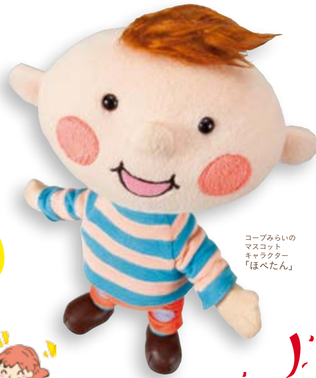
コープみらいのマスコットキャラクター「ほべたん」