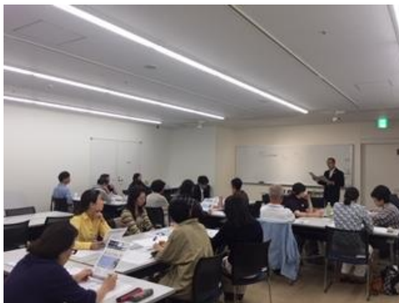
埼玉県オリンピック・パラリンピック課からのご案内風景

今年度から本番に向け、テストホームステイも検討しております。現在、加須市のコロンビアラグビーチームのホームステイが決定しています。今後もホストタウン含め、本番に向けてのテストホームステイを行いたいと思っております。