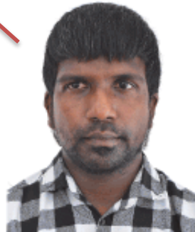
MOHAMED MAZIN Para Athlete (T-11) Athletics - 100m