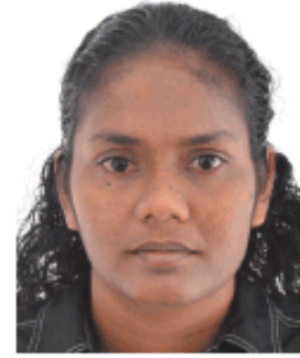
FATHIMATH IBRAHIM Para Athlete (T-11) Athletics - 100m