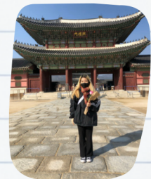
ソウルの名所、キョンボックン

最近ソウルの物価が上がっていますが、電車賃は安くて便利なのでどこでも行きやすいです。ぜひ遊びに来てください！💖