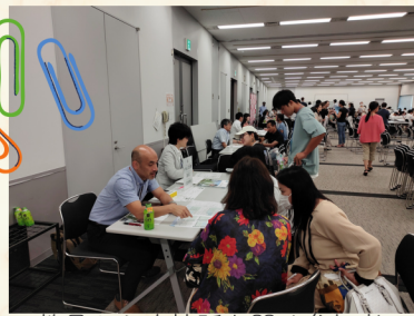
教員から直接話を聞く参加者

8月5日（土）、大宮ソニックシティ（市民ホール）にて開催しました。前半は入学試験・学費・在留資格等の説明、先輩の体験談を行いました。後半は前半の説明に関することや各学校（15校）、日本語教室等の相談を参加者個別に行いました。