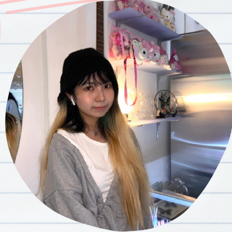
ソウルの可愛いカフェ「リンリン(LingLing)」にて

出身は韓国のソウルです。今年の春まで獨協大学の交換留学生でした。日本語の勉強を始めたきっかけは高校の第2外国語です。第2外国語はあまり大事な科目ではないですが、私は日本のアニメが大好きなので楽しく勉強しました。コロナ禍では家に閉じこもって日本語の勉強ばかりしていました。