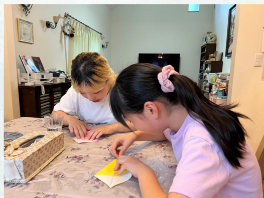
子供と二人で折り紙を折る学生