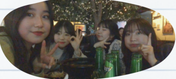
ソウルのおしゃれな居酒屋(ポチャ)