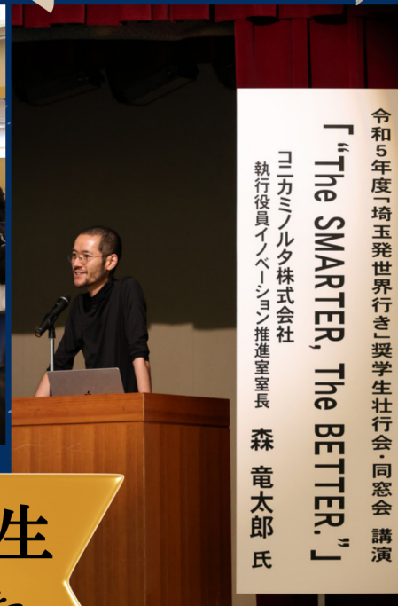
▲講演後は時間いっぱいまで奨学生から質問が寄せられました！