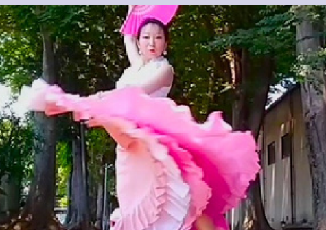
アルゼンチン・タンゴ (AMIGO)

同時開催 「コープみらいフェスタ in さいたまスーパーアリーナ」 「医療生協さいたま健康フェスタ」「埼玉物産観光フェア」