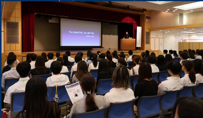
▲聞き入る奨学生ら