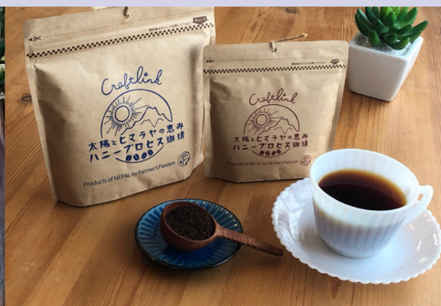
ハニープロセス珈琲 (シア・ザ・プラネット)