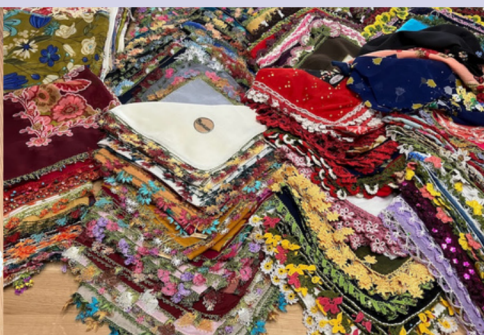
オヤで縁取られたスカーフ (クルド文化教室)