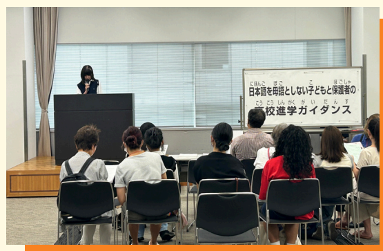
高校に進学した先輩の体験談の様子