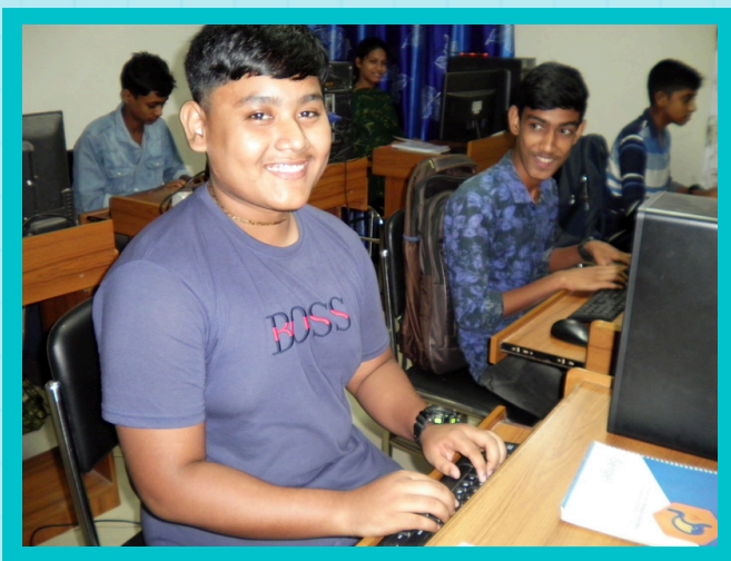
生徒職業訓練の様子