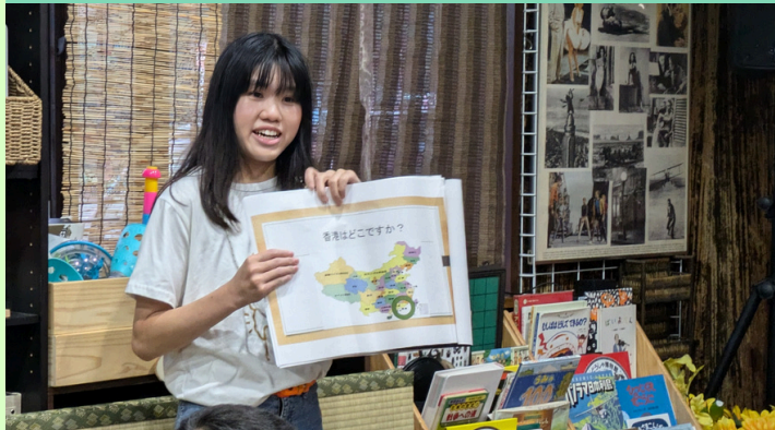
交流イベントの様子

グローバル人材育成センター埼玉（GGS）では、県内の外国人留学生と子ども達との交流事業をコーディネートしています。子ども食堂や児童館などへ県内大学に在籍する外国人留学生が訪問し、母国の文化紹介を通して子ども達との交流を行っています。子ども達に、外国の文化を知ってほしい、外国人留学生と交流する機会を持ちたい、という「子どもの居場所づくり活動実施団体等」を募集しています。ぜひお気軽にお問い合わせください。