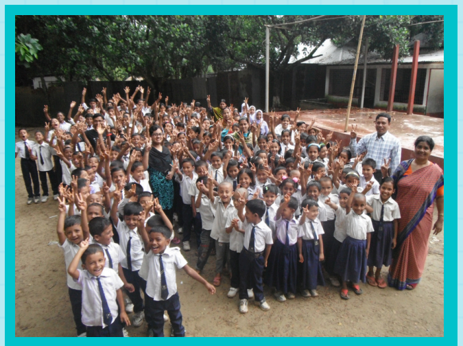
YOU&ME International School Bangladeshのみなさん