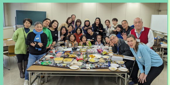
研修会後の交流会の様子

研修会やオンラインミーティングを通じて、授業のコツやアイデアなど、他の講師と情報交換もできます。日本人アドバイザーによるサポートもあるので、初めての方もぜひお気軽にご応募ください。