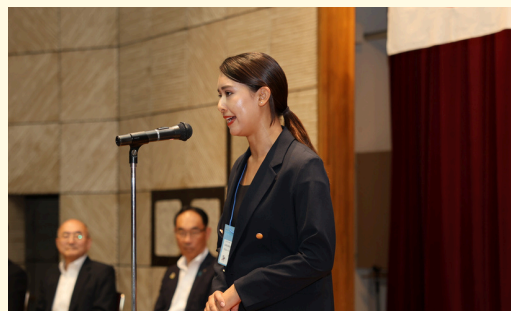
奨学生代表の決意表明