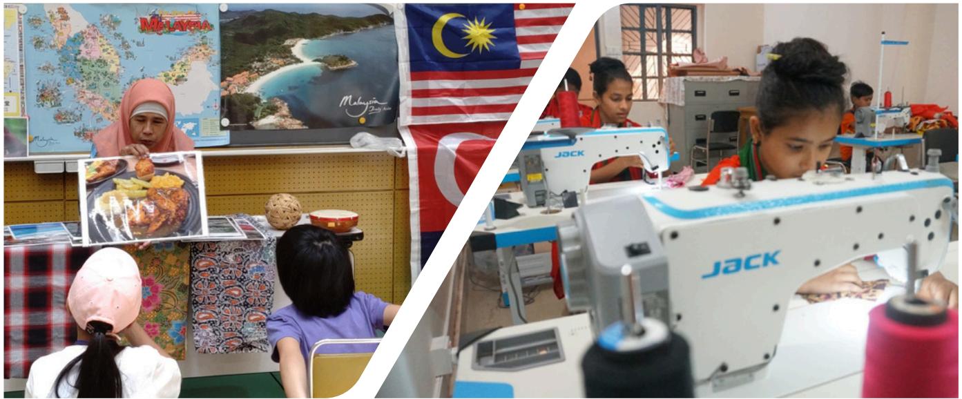
「世界へのトビラ」国際理解教育事業 埼玉県立加須げんきプラザでの活動の様子