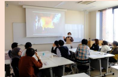
防災に関する情報提供