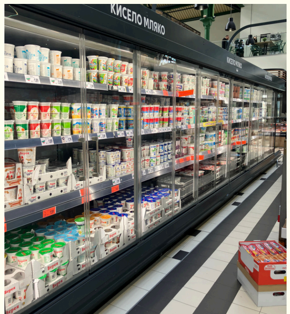
▲ヨーグルト売り場にて