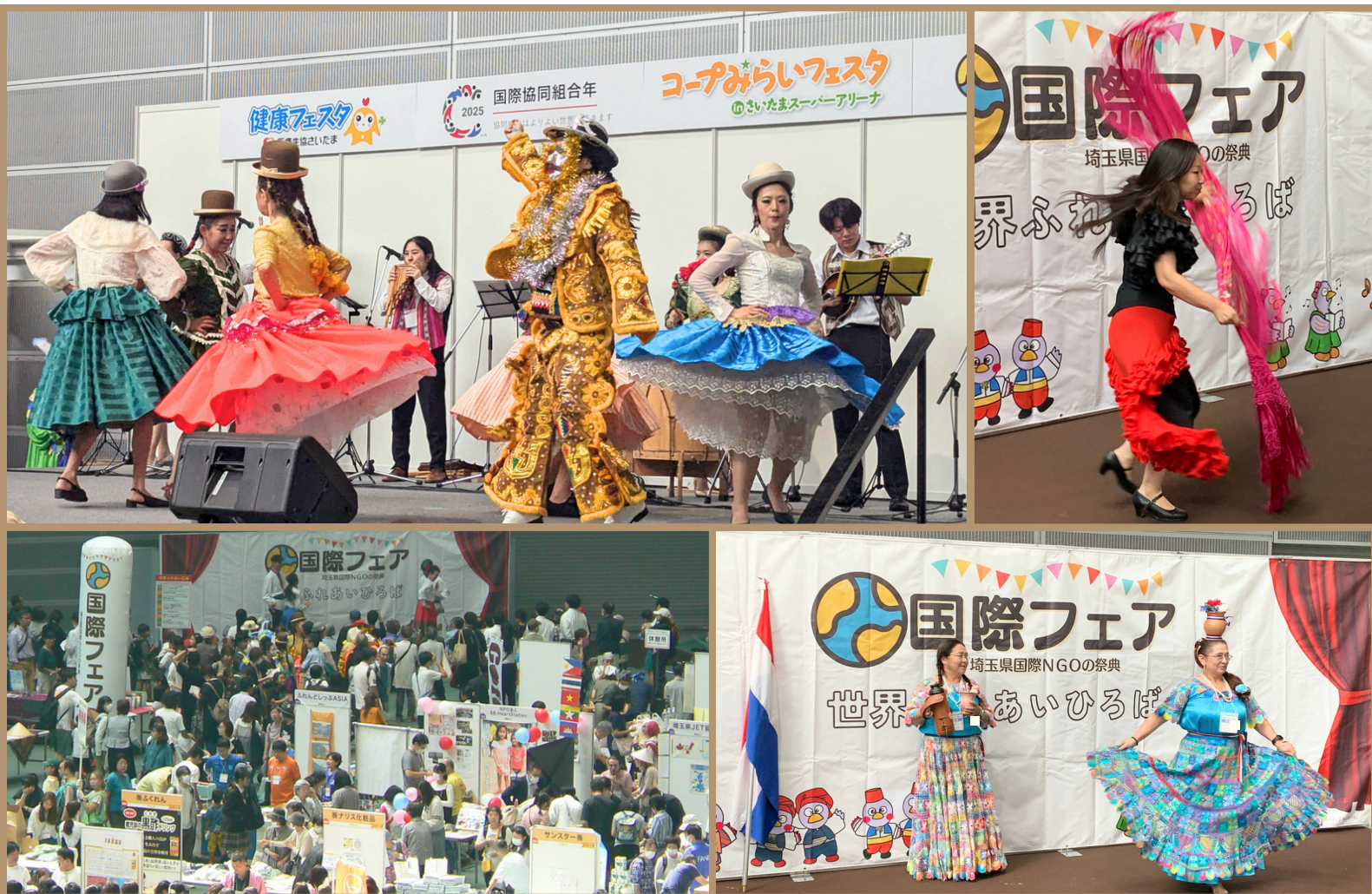
(写真) 国際フェアの様子