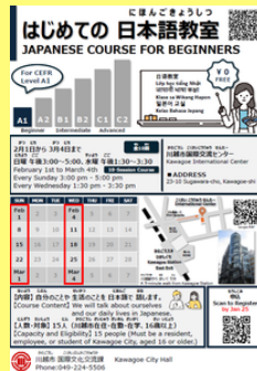
募集用チラシ (川越市作成)