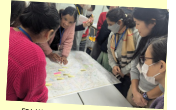
「防災」をテーマにした活動中、地図で避難所を確認する様子 (川越市)