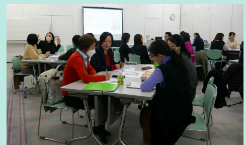
研修中、参加者同士で活発に意見交換を行いました。